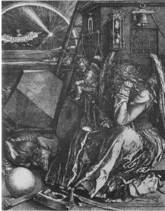
(Abbildung 1) Albrecht DÜRER, Melencolia I , 1514