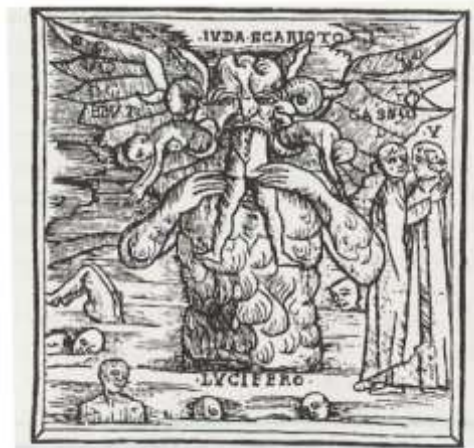
(Abbildung 5) Lucifer verschlingt die Erzverräter Judas, Brutus und Cassius Stich von Bernadino STAGNINO, Venedig 1512