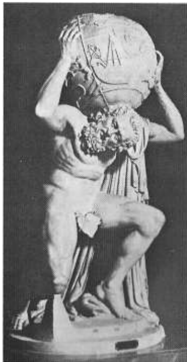
(Abbildung 6) Atlas , römisch, 1. JH n. Chr. Museo Nazionale, Neapel