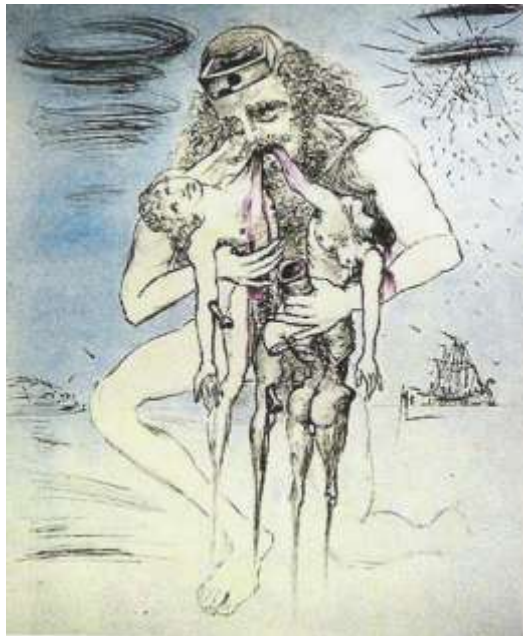
(Abbildung 2) Salvador DALÍ, Kronos , 1963-1965