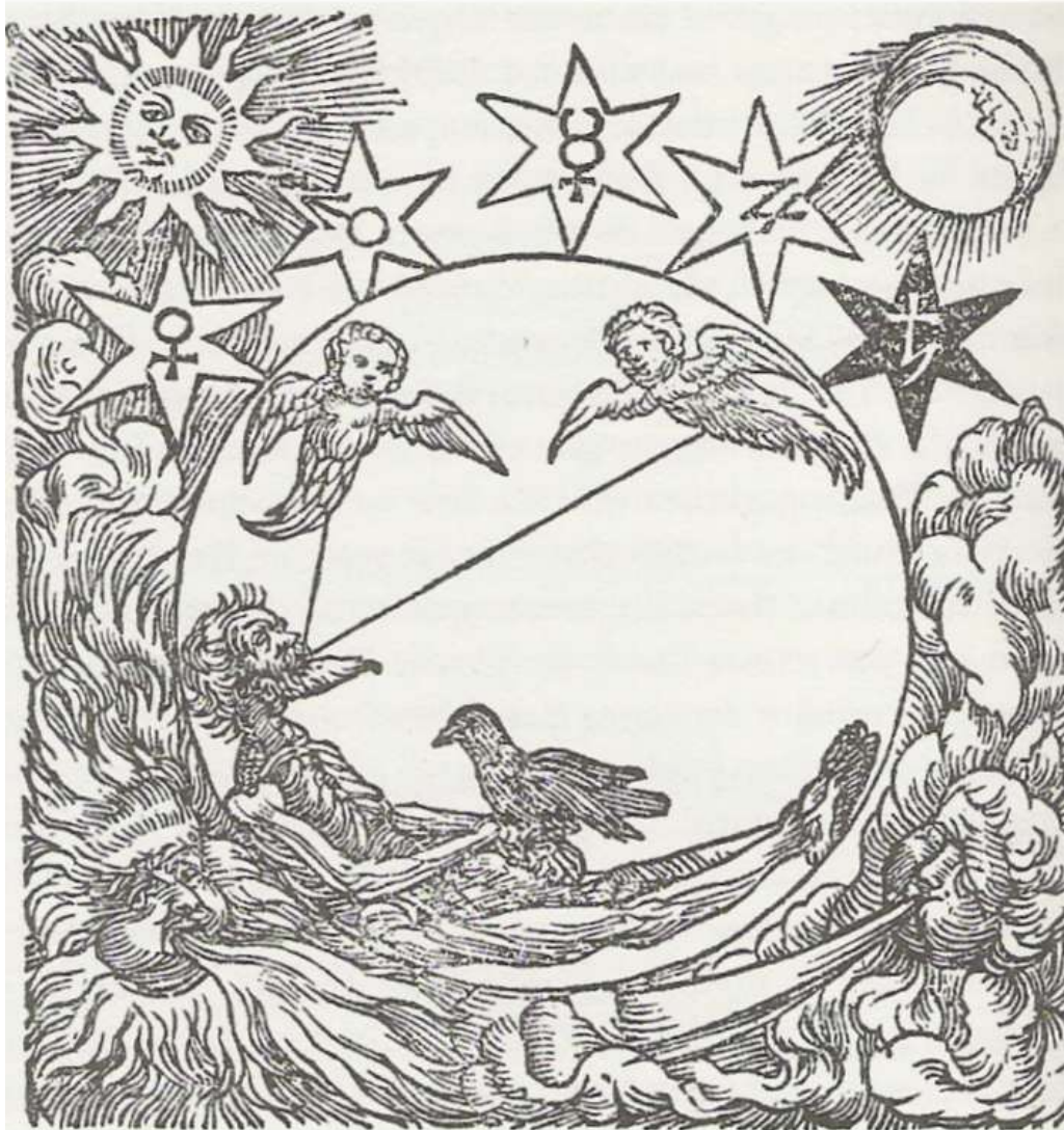
Nigredo Theatrum Chemicum, 1613

Das Rabenhaupt ist der Anfang der Kunst.