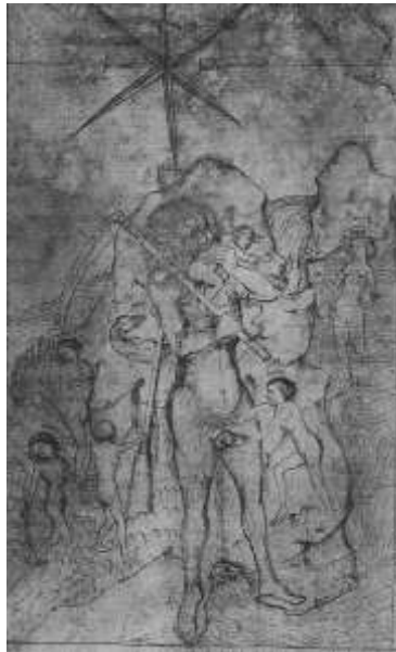
(Abbildung 3) Die Kastration Saturns , 1. Drittel des 15. Jahrhunderts Kupferstichkabinett, Dresden