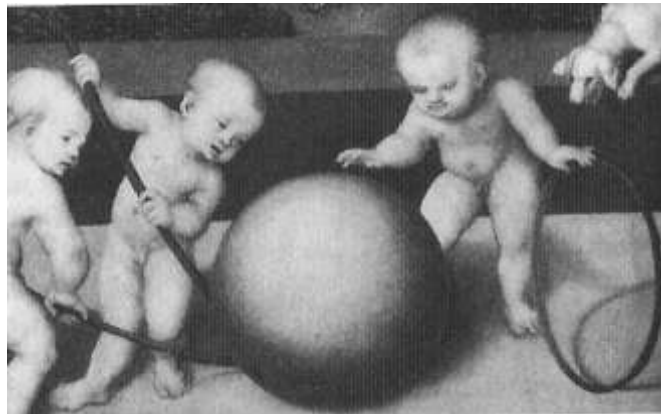
(Abbildung 4) Lucas CRANACH, Melancholie , 1532 (Ausschnitt) Statens Museum for Kunst, Kopenhagen